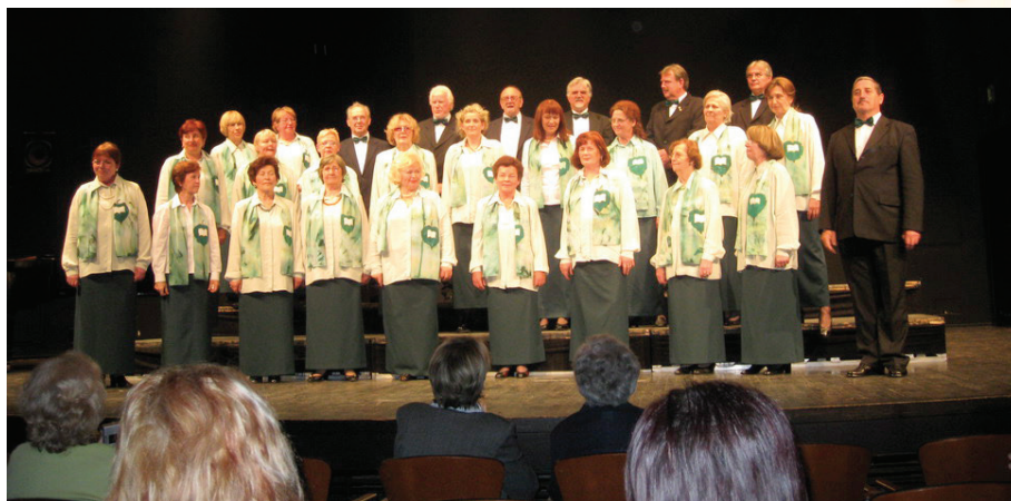
Nastup zbora KPD Slovenski dom Zagreb, na koncertu Primorska poje , 16. svibnja 2010. godine u maloj KD Vatroslava Lisinskog

Nastop zbora KPD Slovenski dom Zagreb na koncertu Dobrodošli, prijatelji , ki je potekal 12. aprila 2018 v prostorih društva, na katerem je nastopal tudi Lovski pevski zbor Medvode.