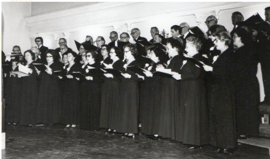
Pedeseta obljetnica društva KPD Slovenski dom Zagreb, u Hrvatskom glazbenom zavodu 9. svibnja 1979. godine