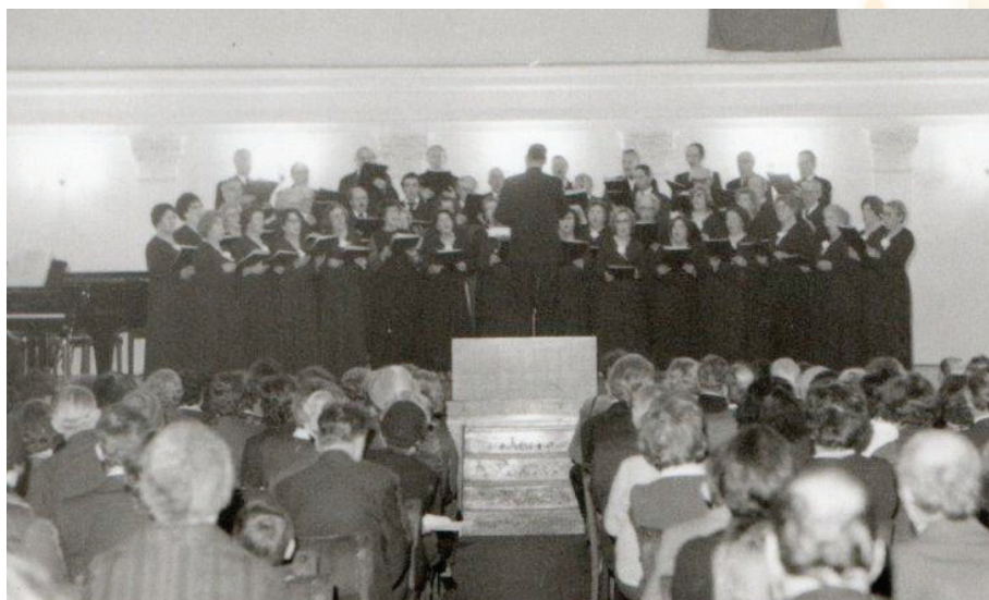
Nastup zbora KPD Slovenski dom Zagreb, u Hrvatskom glazbenom zavodu 1977. godine Nastop zbora KPD Slovenski dom Zagreb v Hrvaškem glazbenem zavodu I. 1977