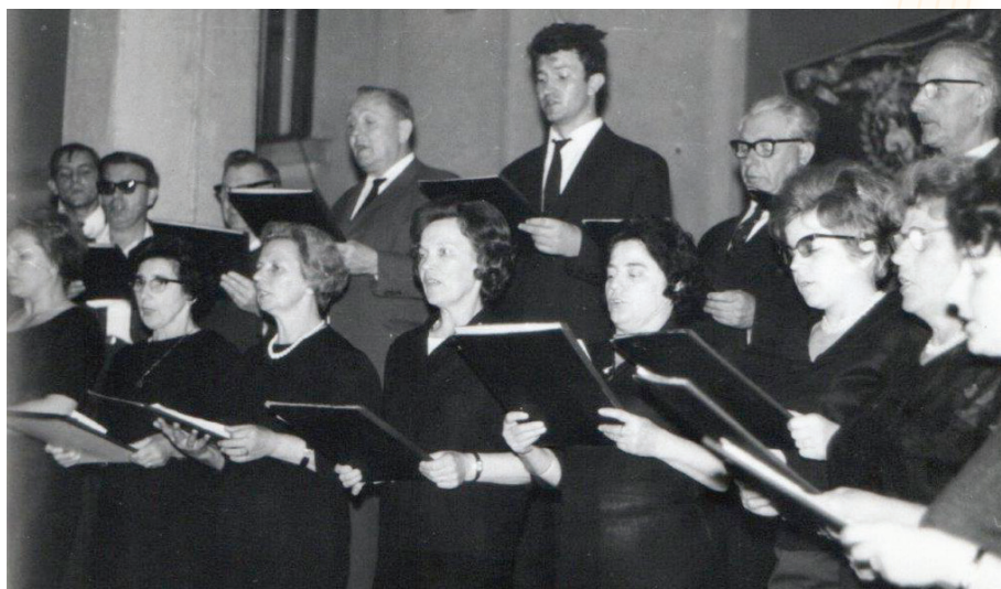
Neki od nastupa zbora KPD Slovenski dom Zagreb, sedamdesetih godina dvadesetog stoljeća Nekateri od nastopov zbora KPD Slovenski dom Zagreb v sedemdesetih letih dvajsetega stoletja