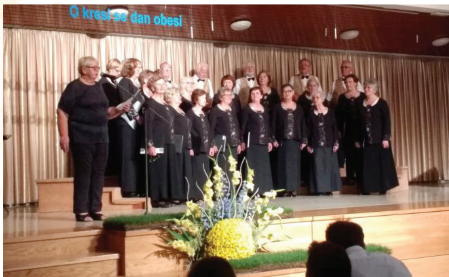
Nastup zbora KPD Slovenski dom Zagreb, na Taboru slovenskih pjevačkih zborova Šentvid pri Stični , 16. lipnja 2018. godine

Nastup zbora KPD Slovenski dom Zagreb v Hrvaškem glasbenem zavodu v Zagrebu 28. marca 2008