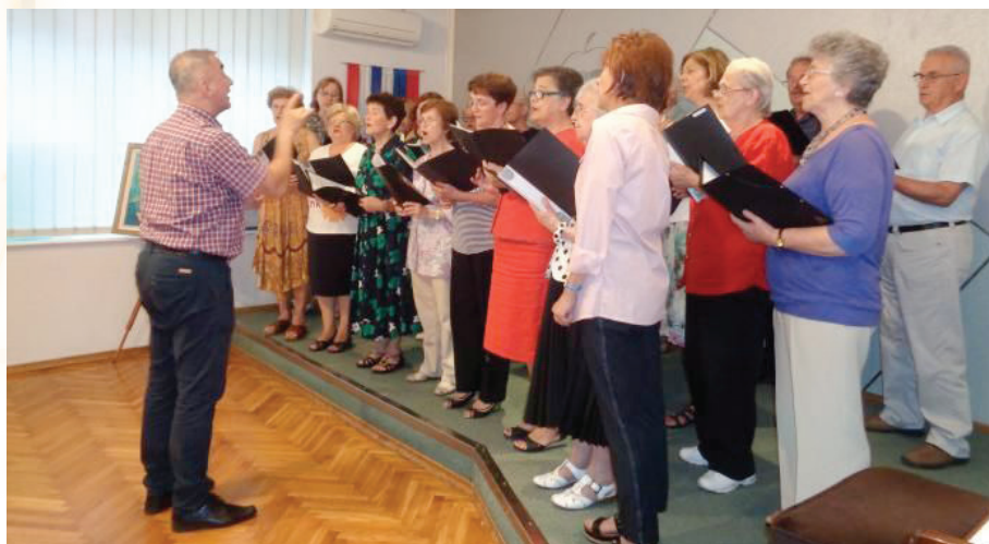
Otvorenje likovne izložbe Bože Jembrih, 6. lipnja 2018. godine u Slovenskom domu Zagreb, obogatio je i nastup zbora KPD Slovenski dom Zagreb Odprtje likovne razstave Bože Jembrih 6. junija 2018 v Slovenskem domu Zagreb je popestril tudi nastop zbora KPD Slovenski dom Zagreb.