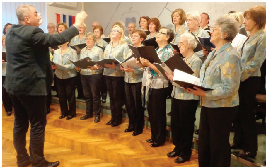
Nastup zbora KPD Slovenski dom Zagreb, na koncertu Dobrodošli prijatelji , održanom 12. travnja 2018. godine u Društvu, gdje je nastupao i Lovački pjevački zbor iz Medvoda

Nastop zbora KPD Slovenski dom Zagreb na koncertu Dobrodošli, prijatelji , ki je potekal 12. aprila 2018 v prostorih društva, na katerem je nastopal tudi Lovski pevski zbor Medvode.