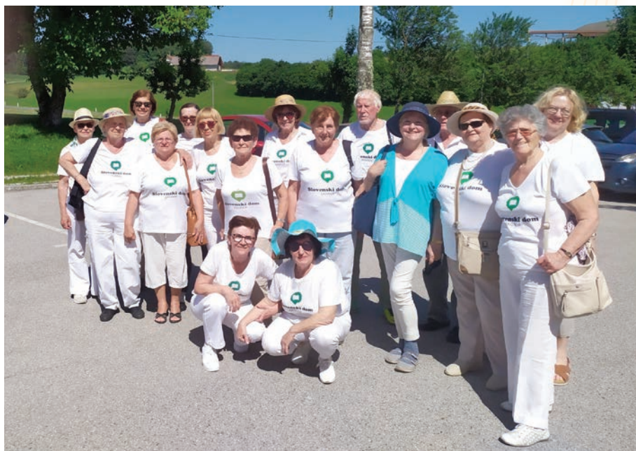
Šentvid pri Stični, 17. lipnja 2022. godine Šentvid pri Stični, 17. junij 2022