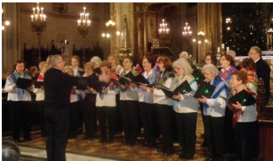
Nastup zbora KPD Slovenski dom Zagreb, na koncertu božićnih pjesama nacionalnih manjina Grada Zagreba, 8. siječnja 2020. godine u Zagrebačkoj katedrali Nastup zbora KPD Slovenski dom Zagreb na koncertu božićnih pesmi narodnih manjšina Mesta Zagreb 8. januarja 2020 v zagrebški katedrali