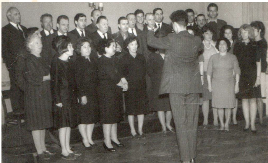
Neki od nastupa zbora KPD Slovenski dom Zagreb, sedamdesetih godina dvadesetog stoljeća