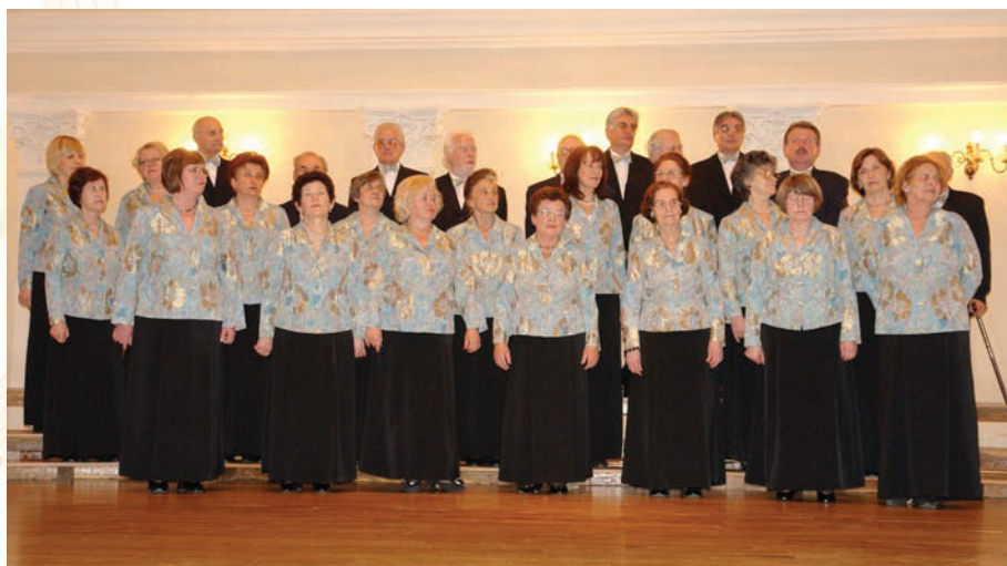
Nastup zbora KPD Slovenski dom Zagreb, u Hrvatskom glazbenom zavodu u Zagrebu, 28. ožujka 2008. godine

Nastup zbora KPD Slovenski dom Zagreb v Hrvaškem glasbenem zavodu v Zagrebu 28. marca 2008