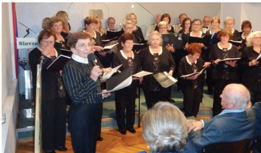
Nastup zbora KPD Slovenski dom Zagreb, na koncertu U pjesmi je naša mladost a u njoj naš ponos , 3. listopada 2019. godine u Slovenskom domu Zagreb, gdje je nastupao i pjevački zbor Društva umirovljenika Metlika Nastop zbora KPD Slovenski dom Zagreb na koncertu V pesmi je naša mladost, v njej pa naš ponos 3. oktobra 2019 v Slovenskem domu Zagreb, na katerem je nastopal tudi pevski zbor Društva upokojevcev Metlika.