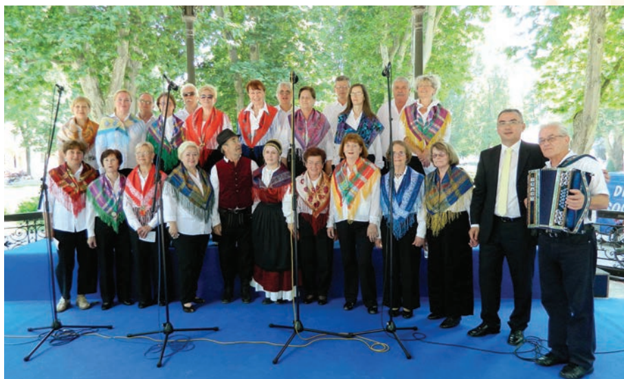
Nastup zbora KPD Slovenski dom Zagreb, na Danu nacionalnih manjina Grada Zagreba, 16. lipnja 2013. godine u zagrebačkom parku Zrinjevac Nastup zbora KPD Slovenski dom Zagreb na dnevnu narodnih manjšina Mesta Zagreb 16. junija 2013 v zagrebškem parku Zrinjevac