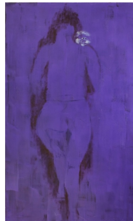
Prva stran: Slepa miš X (Berač) , 2007, olje, vosek, klej in pigmenti na platnu, 170 x 100 cm

negotovost, usodnost so prav gotovo pravilni izrazi k tem slikam. V tem da vsak mladostnik doživlja vsaj posamezne elemente iz te zgodbe in da je vsak odrasel v času svojega odrasčanja kdaj občutil čustva iz te zgodbe, je univerzalnost slikarjeve pripovedi; ni več le njegovo osebno doživetje, ampak je to lahko zgodba vsakega od nas. In če podoživimo to pripoved z zaprtimi očmi, jo zagotovo še dolgo nosimo s sabo.